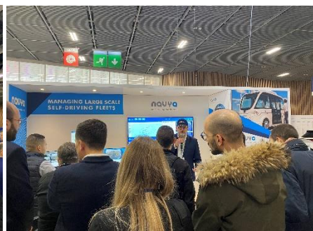
NAVYA présente en exclusivité mondiale son système de shepherding (supervision à distance d'une flotte de navettes sans opérateur à bord) lors du salon Autonomy à Paris

Gérer, superviser, sécuriser, anticiper : NAVYA a pu faire la démonstration de sa gestion holistique de la supervision en déroulant une série de scénarios critiques : obstacle sur la route causé par un objet, piéton distrait sur la voie, malaise d'un passager, départ d'incendie sur le trajet, etc... Ce sont en tout 11 scénarios qui ont été projetés en simulation réelle pour que NAVYA puisse démontrer son dispositif sous le prisme des événements possibles en présentant les réponses et réactions apportées à chaque imprévu pour la plus grande sécurité des passagers et des autres usagers de la route.