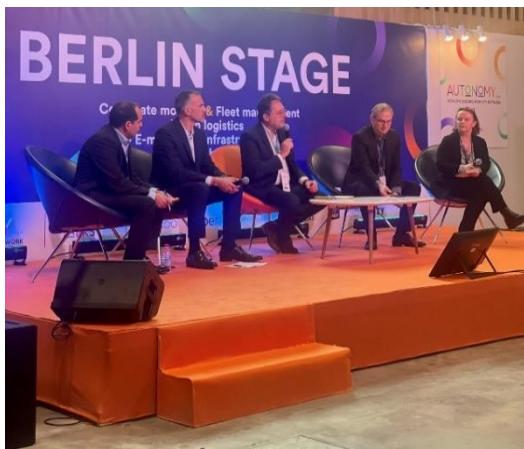
Table ronde : Vision de NAVYA du L4 & écosystèmes associés

Acteur mondial reconnu du niveau 4, NAVYA a également animé une table ronde sur le thème de la vision du L4 et des écosystèmes associés avec des intervenants de haut vol qui ont exprimé les enjeux et les solutions liés à la mobilité autonome sans opérateur à bord.